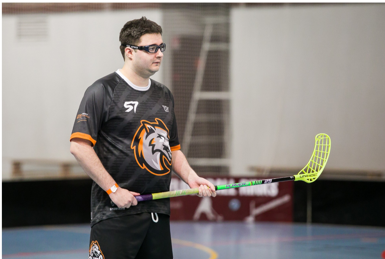
La défense nancéienne a été totalement dépassée et n'avait pas encaissé autant de buts depuis les playoffs de 2019.

Ce manque de respect de l'adversaire va d'ailleurs être payé par les Lorrains. En moins d'un quart d'heure, Mulhouse touche les montants et plante trois buts à Nancy.