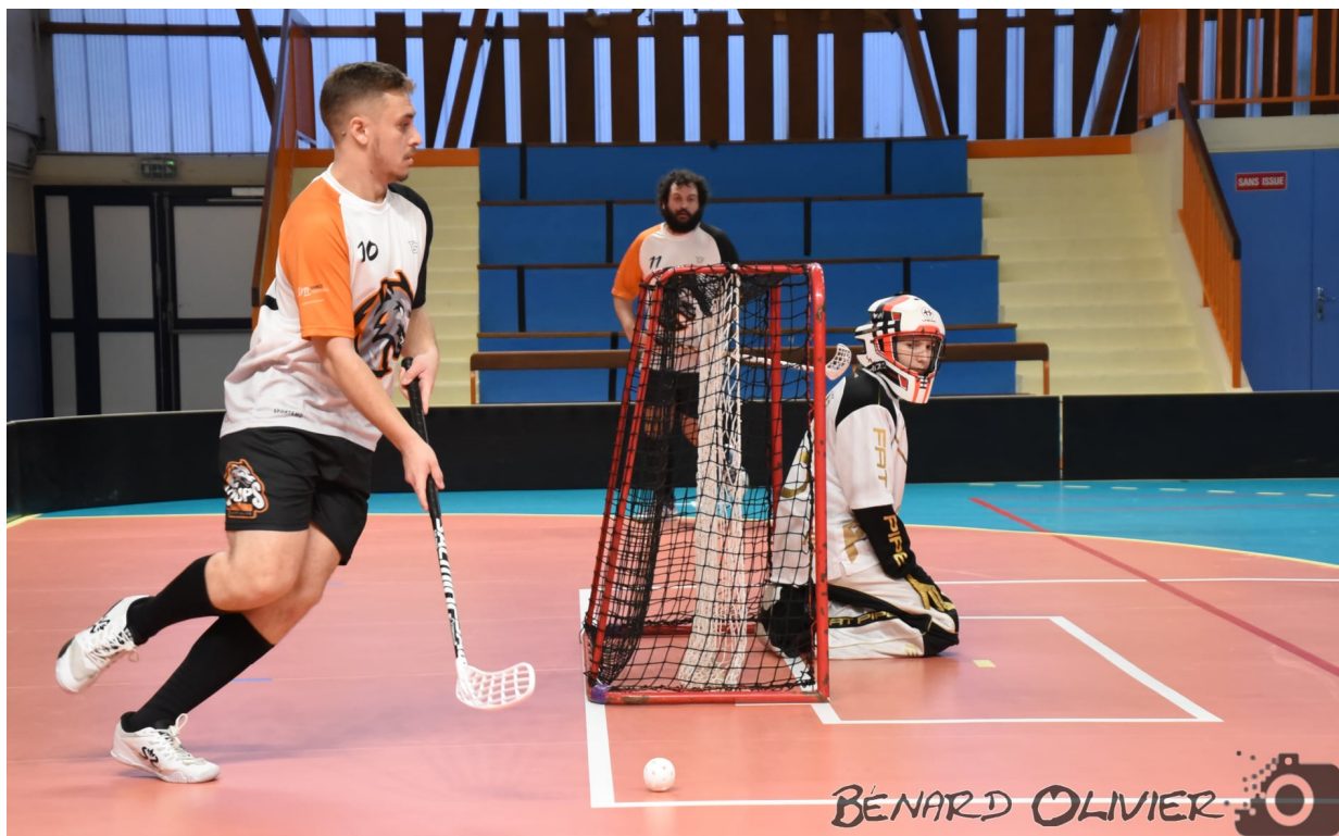
Surpris sur les premières attaques, la défense lorraine a su retrouver ses automatismes pour être un appui solide aux nombreuses offensives.

Embourbé dans le piège brunoyen, Nancy va encaisser deux buts en moins de dix minutes. Le premier en supériorité numérique sur une inspiration du chat noir des Loups, Girardot (0-1 ; 23 e ). Le second arrivera peu de temps après et dans la confusion la plus totale. Barbet est au sol suite à une